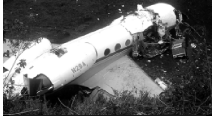
Pilotos perderam controle do avião após pousarem em aeroporto

- o ministro das Finanças, Matata Ponyo, o governador de Sul-Kivu, Marcelin Cishambo e o embaixador itinerante do presidente, Antoine Ghonda - ficaram gravemente feridos no acidente e foram transferidos à África do Sul.