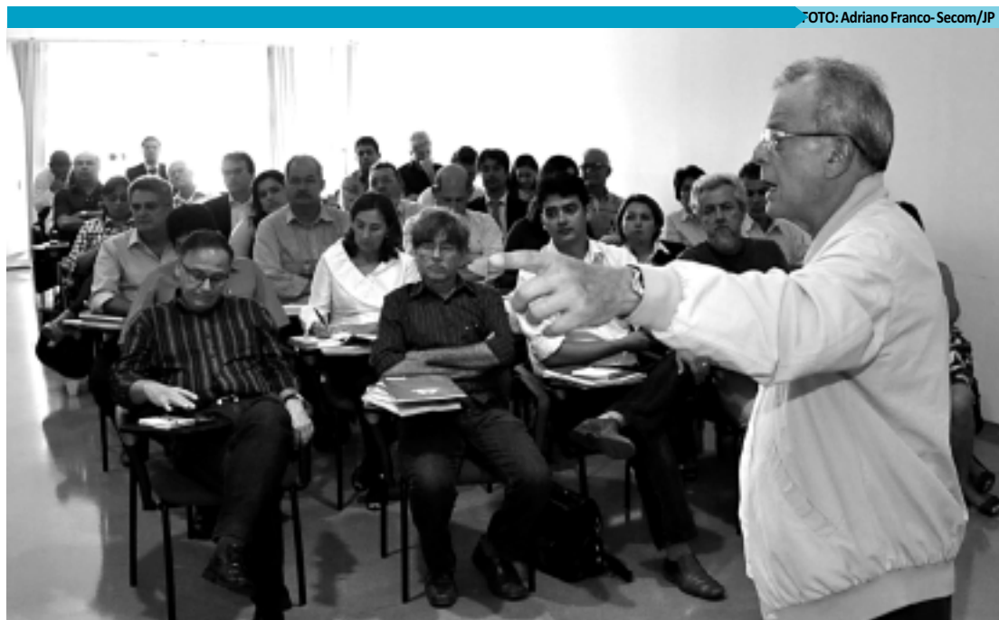
No primeiro encontro do ano, que durou quase todo o dia, prefeito e secretários fizeram um balanço de 2011

Além dessas matérias que passaram pela CCJ, no âmbito da Comissão de Orçamento foi aprovada também a MP do Governo que trata de remanejamento de dotações orçamentária, no valor de R$ 12,6 milhões no âmbito do Ministério Público do Estado. "Este ano vamos dar seguimento ao trabalho realizado ano passado, quando cumprimos todos os prazos regimentais", declarou o deputado Gervásio Maia (PMDB), presidente da Comissão.