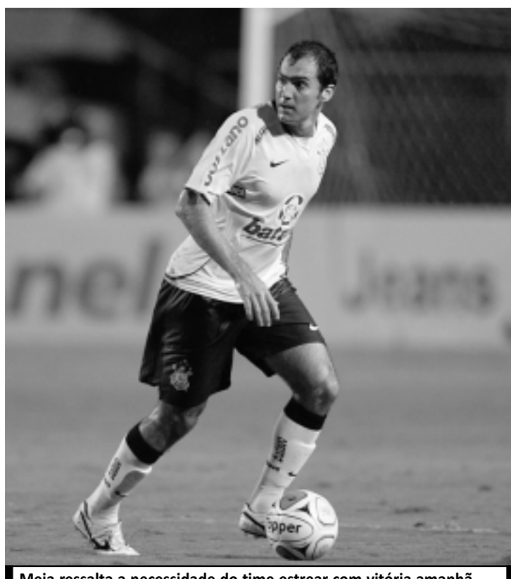
Meia ressalta a necessidade do time estreiar com vitória amanhã

Danilo reconheceu que o Corinthians disputará a Libertadores pressionado a ser campeão, mas garantiu que a