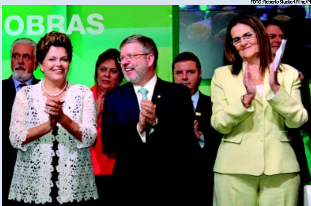
Dilma participou da solenidade de posse de Graça Foster na Presidência da Petrobras no Rio de Janeiro