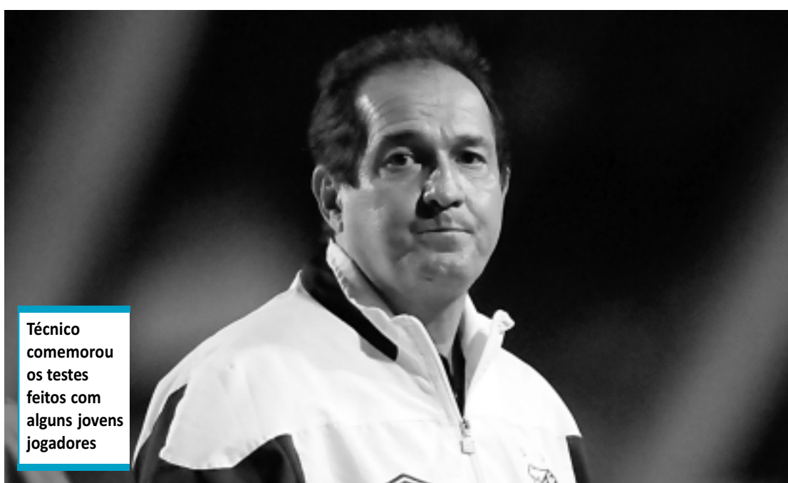
Técnico comemorou os testes feitos com alguns jovens jogadores

Com foco na estreia da Libertadores, contra o The Strongest, amanhã, o Santos voltou a utilizar os reservas no Campeonato Paulista. Diante do Linense, no último domingo, a equipe conseguiu uma de suas melhores atuações no ano e goleou por 4 a 1, em São Bernardo, pela sétima rodada.