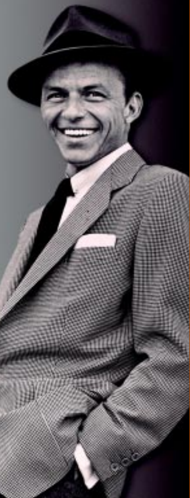
BIOGRAFIA A ligação de Sinatra com a máfia PÁGINA 17

Em Sinatra - A Vida, biógrafos afirmam que carreira do cantor teve ajuda da máfia