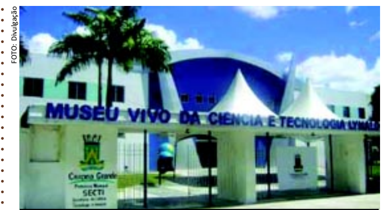
[FOTO&LEGENDA] Estão sendo oferecidos no Museu Vivo de Ciência e Tecnologia cursos e oficinas para alfabetização digital de artesãos e profissionais liberais. Além de oferecer outros cursos, ali também também poderão ser feito o cadastro para abertura de lojas virtuais.