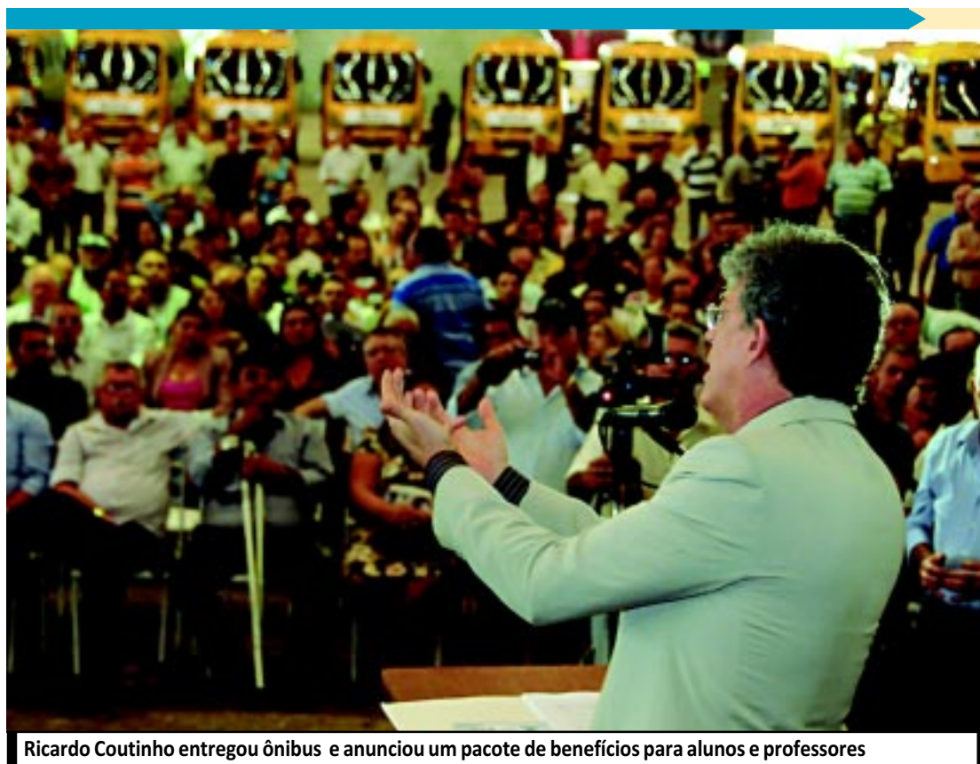
Ricardo Coutinho entregou ônibus e anunciou um pacote de benefícios para alunos e professores

nhos entregou os veículos aos prefeitos em solenidade no Espaço Cultural. A ação faz parte do Programa Paraíba faz Educação, e tem como objetivo reduzir o transporte inadequado de alunos. PÁGINA 9