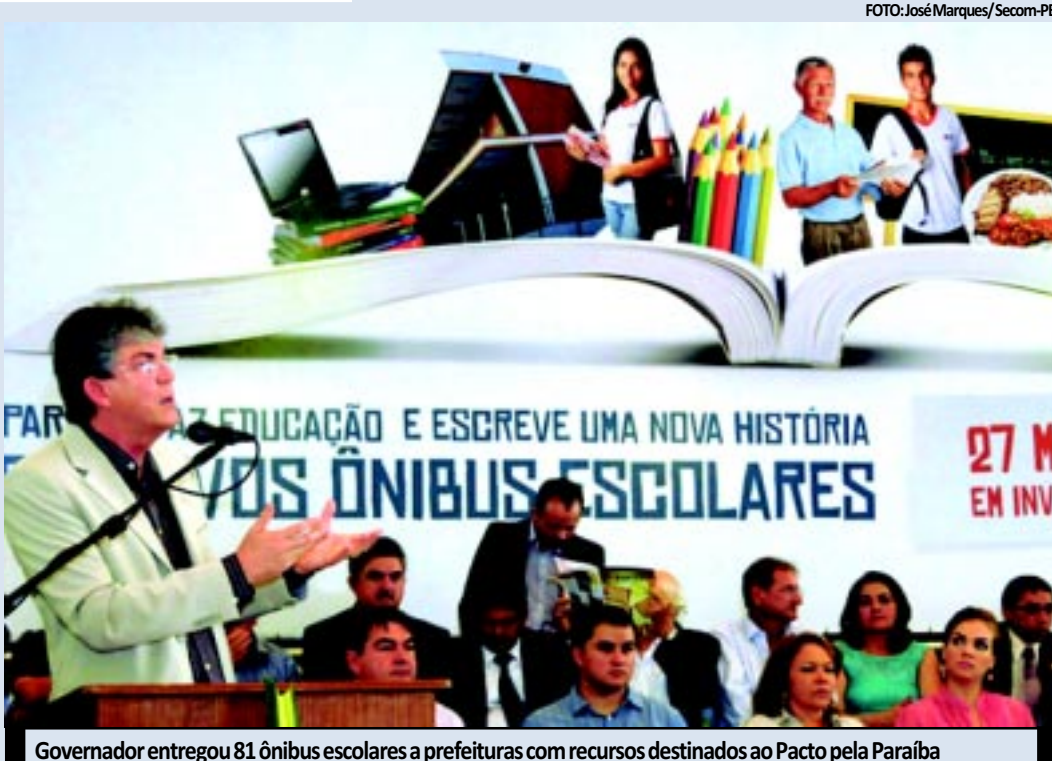
Governador entregou 81 ônibus escolares a prefeituras com recursos destinados ao Pacto pela Paraíba