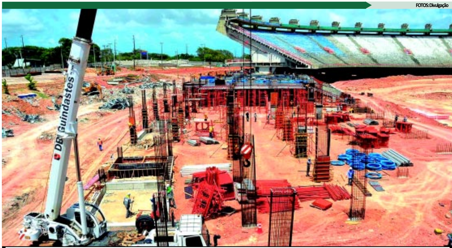
O Castelão é um dos estádios da Copa onde as obras estão mais avançadas, mas algumas distorções salariais provocaram uma greve dos operários

O consórcio Arena Multiuso Castelão manifestou-se por meio de nota. Segundo o consórcio, uma reunião já estava previamente agendada e seria discutido o dissídio da categoria, a ser celebrado apenas no mês de abril. O consórcio se mostrou ainda surpreso e aguarda um ofício do sindicato indicando quais são as reivindicações.