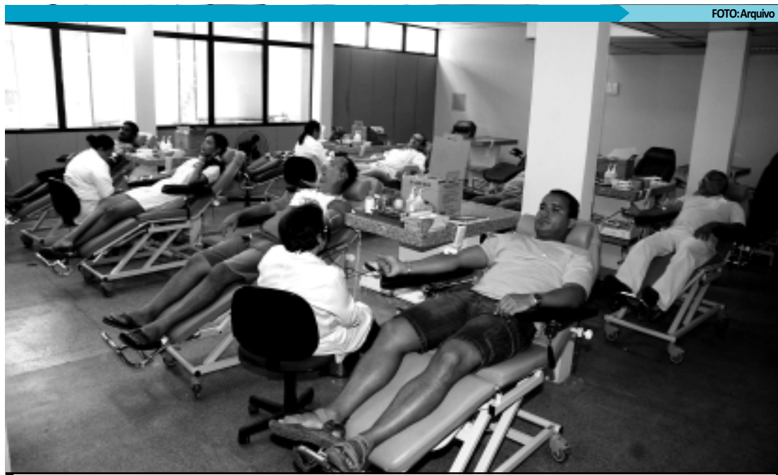
Menor de 16 anos já pode doar sangue e a idade máxima passou de 65 para 68, segundo lei sancionada por Dilma

Para evitar problemas com a falta de sangue, o Hemocentro está conclamando todos os doadores, tanto os fidelizados, que são aqueles que aparecem no tempo certo de doar, como também os voluntários, para que todos façam suas doações. "Esse chamamento não é só para João Pessoa, mas também para todo Estado onde temos a rede de hemonúcleos", disse Divane.