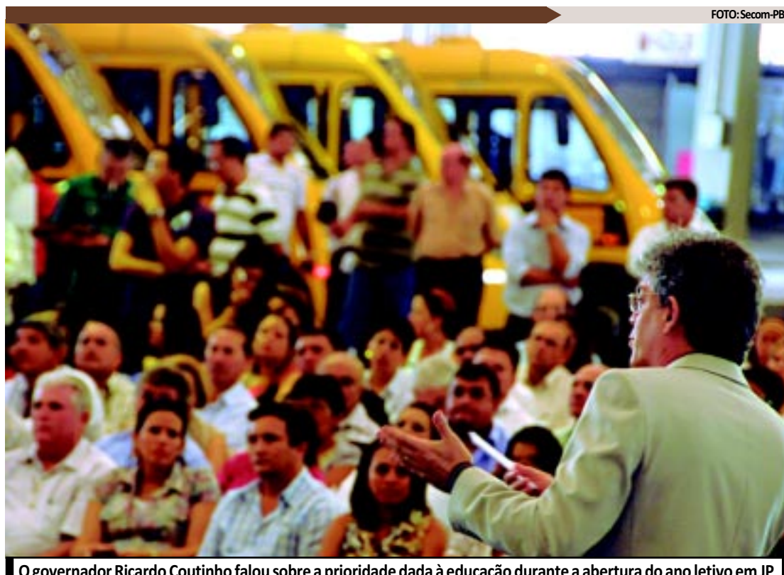
O governador Ricardo Coutinho falou sobre a prioridade dada à educação durante a abertura do ano letivo em JP