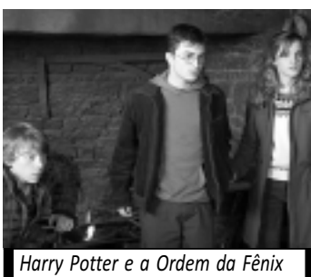
Harry Potter e a Ordem da Fênix