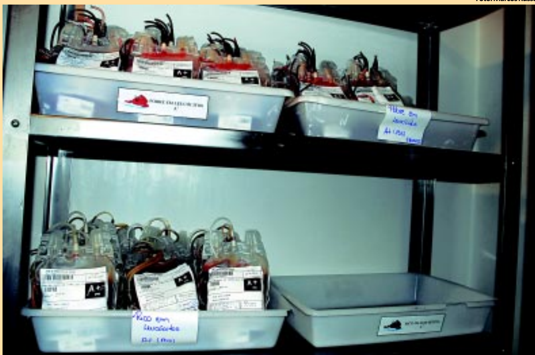
O estoque de sangue no Hemocentro de João Pessoa está com apenas 50% da sua capacidade